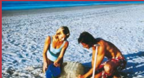
Assurances Vie Prévoyance

Nous vous accompagnons à chaque étape de votre vie