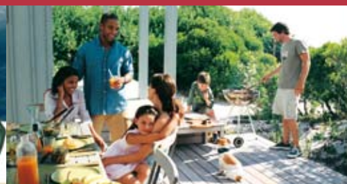
Accidents de la vie privée