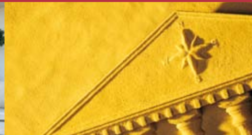
Épargne et Placements