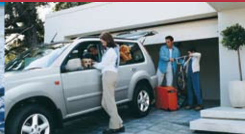
Auto/Moto Déplacements et Loisirs