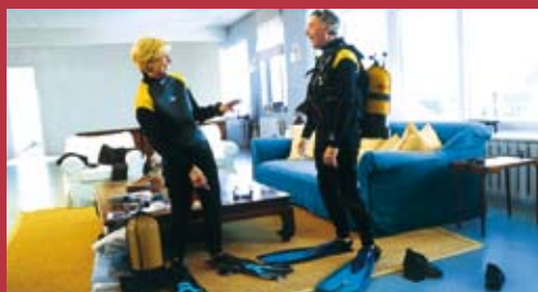
Pension Complémentaire Prévoyance Vieillesse