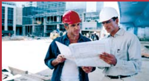
Multirisques Professionnels Entreprise